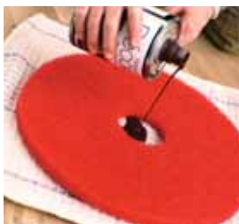
Mořidlo nalijte do středu padu položené na látce.

Pokud byla podlaha ošetřena olejem, přejděte na bod 9. Pokud má být podlaha opatřena vrchním lakem, přejděte na bod 4.