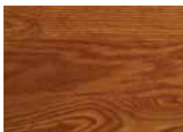
Úpravy dřevěných podlah