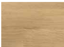
Bona Parquet Décor