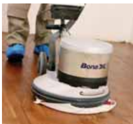
5. Přebytečné mořidlo odstraňte pomocí červeného padu a bílé látky.

Pozn.: Při použití mořidla Bona Parquet Décor White (Bílý) je důležité, aby bylo dosaženo správné kryvosti. Z tohoto důvodu je pro zajištění co nejlepšího výsledku vhodné použít nerezovou špachtli nebo stěrku.