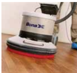
4. Mořidlo rozetřete pomocí červeného padu podložky do 15 minut.