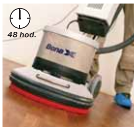
7. Po 48 hodinách mořidlo rozleštíte pomocí červeného padu.